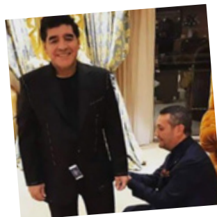
Maradona veste Condotti

Il mercato del Sud Italia è ricco di creatività, offre tanti spazi ancora liberi e ci vivono persone che hanno voglia di fare, con grandi idee ma che non sono supportate a dovere dallo scenario italiano. Il Meridione ha quindi ancora tanto potenziale inespresso.